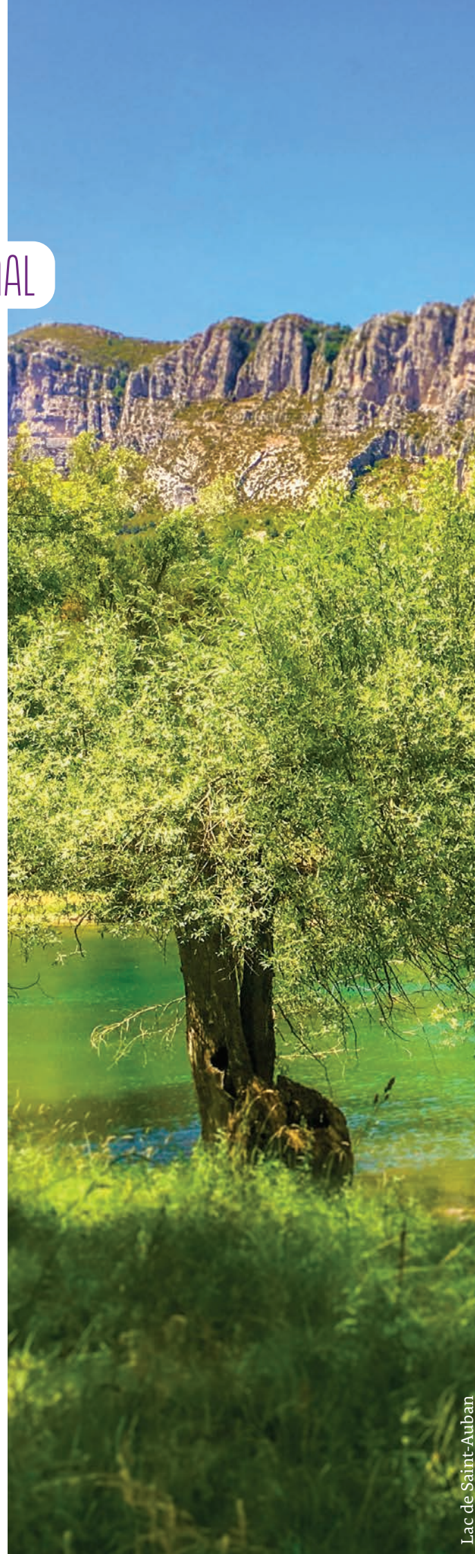
Lac de Saint-Auban

Le PIB constitue une feuille de route partagée entre la CAPG et ses 23 communes. Il a vocation à donner du sens à l'action locale, à faciliter l'appropriation des enjeux par tous les publics et à accompagner la transition écologique du territoire.