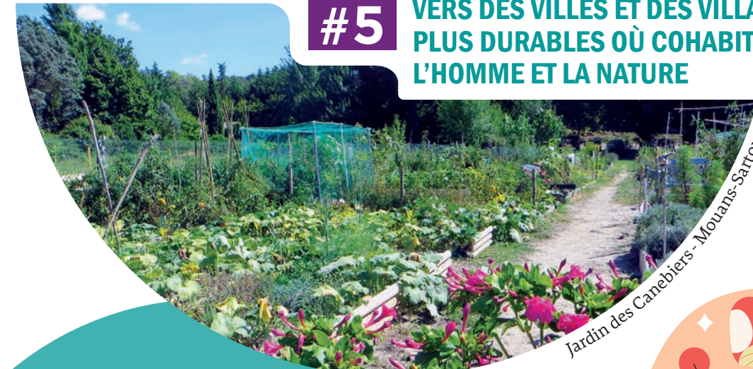
Jardin des Canebières - Moulans-Sartoux

La nature en ville est un levier de bien-être et d'adaptation au changement climatique. La CAPG agit déjà :