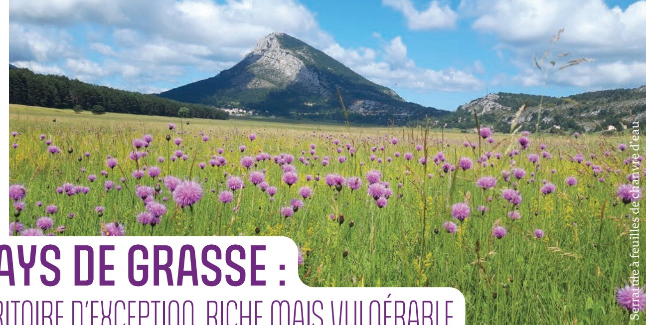
Serratula à feuilles de chanvre d'eau