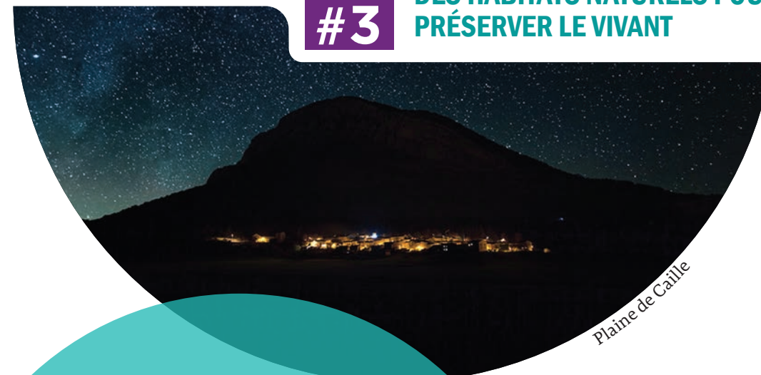
Plaine de Caille

LUTTER CONTRE LA FRAGMENTATION DES HABITATS NATURELS POUR PRÉSERVER LE VIVANT