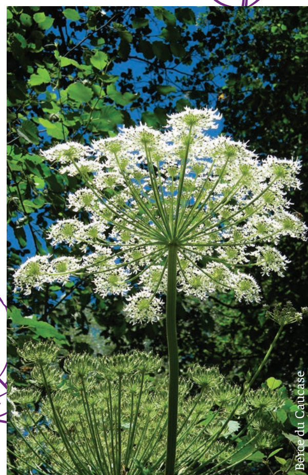
Berce du Caucase

Le PIB constitue le cadre stratégique et opérationnel permettant de répondre de manière cohérente aux pressions exercées sur la biodiversité et les paysages du territoire.