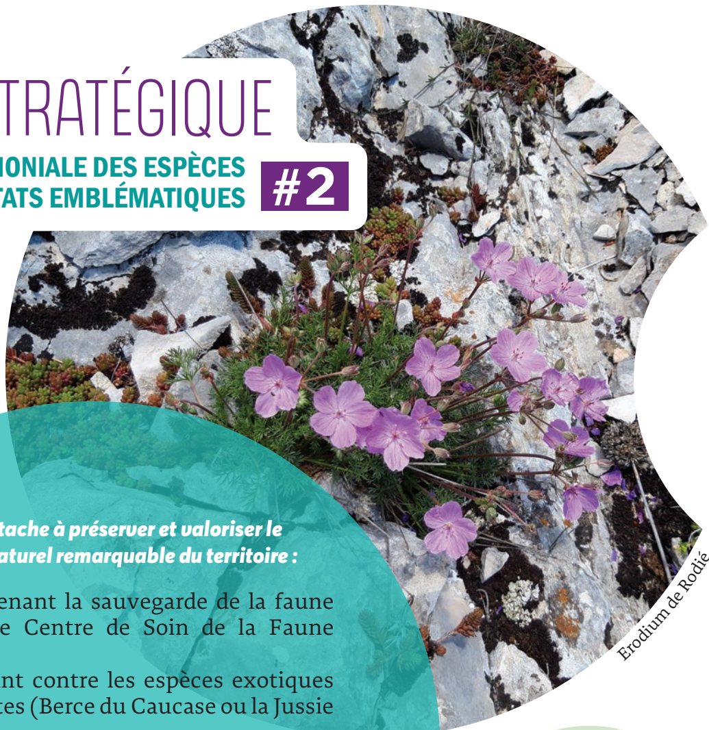
Erodium de Rodié

GESTION PATRIMONIALE DES ESPÈCES ET DES HABITATS EMBLÉMATIQUES #2