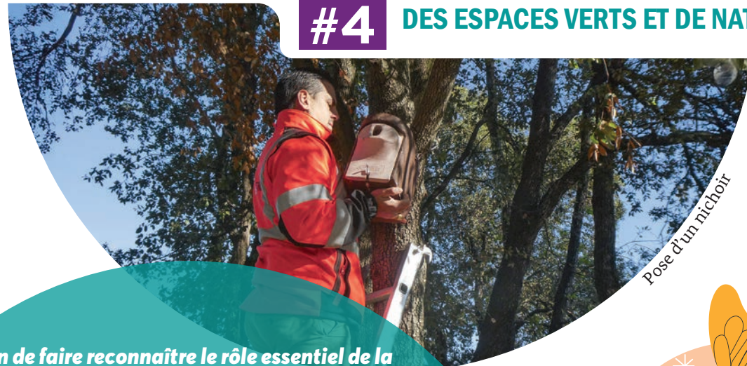
Pose d'un nichoir

Afin de faire reconnaître le rôle essentiel de la biodiversité ordinaire et de redonner toute sa place au vivant dans le tissu urbain, la CAPG déploie des dispositifs favorables à la nature à travers la mise en œuvre :