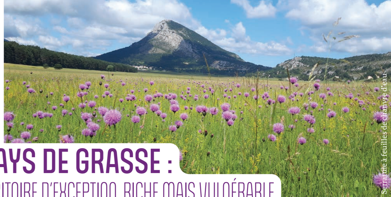
Serratulle à feuilles de chanvre d'eau