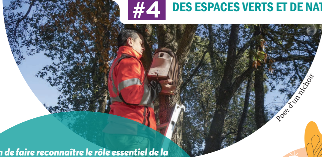
Pose d'un nichoir

Afin de faire reconnaître le rôle essentiel de la biodiversité ordinaire et de redonner toute sa place au vivant dans le tissu urbain, la CAPG déploie des dispositifs favorables à la nature à travers la mise en œuvre :