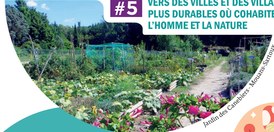
Jardin des Canebières - Moulans-Sartoux

La nature en ville est un levier de bien-être et d'adaptation au changement climatique. La CAPG agit déjà :