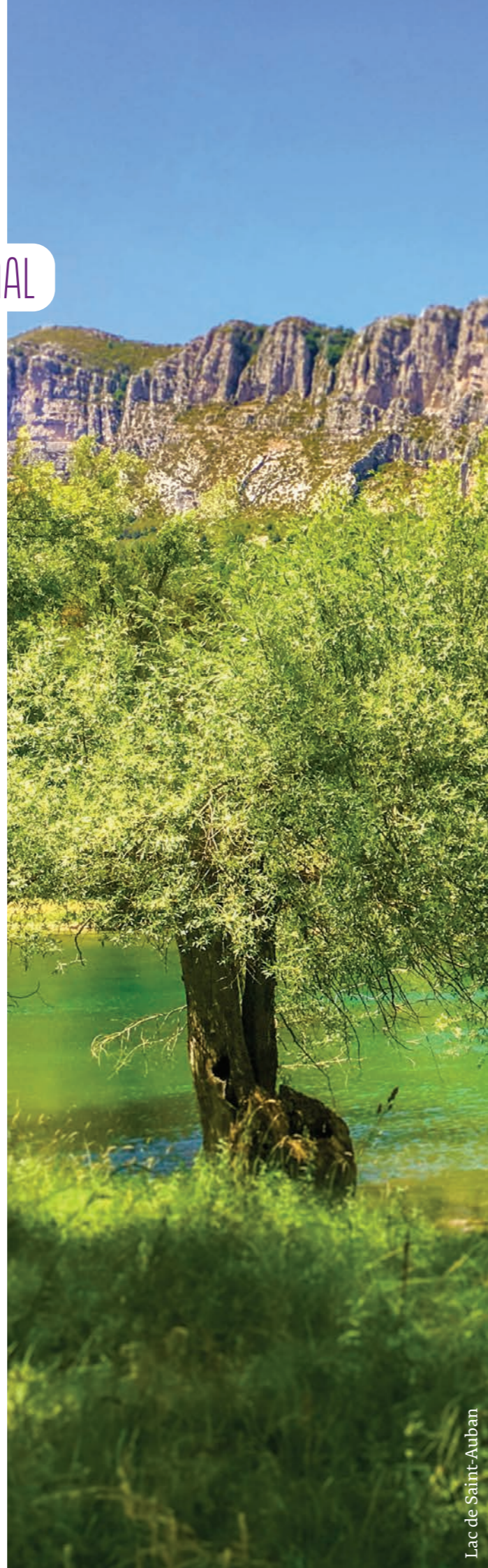
Lac de Saint-Auban

Le PIB constitue une feuille de route partagée entre la CAPG et ses 23 communes. Il a vocation à donner du sens à l'action locale, à faciliter l'appropriation des enjeux par tous les publics et à accompagner la transition écologique du territoire.